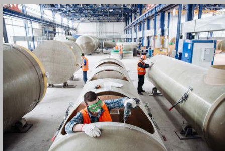
Производство г. Тольятти